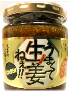
▲うまくて生姜ねえ!! ゴールデン

月色プリンは、コラーゲンがたっぷり1000mg入ったとろり濃厚なプレンとほんのり塩味が甘さを引き立てつつ後味はさっぱりする会津山塩の2種。