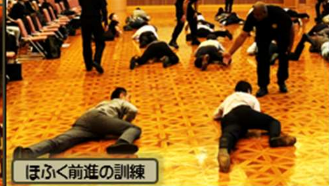
ほふく前進の訓練