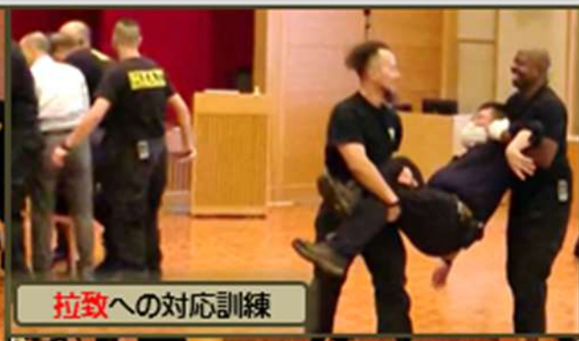
拉致への対応訓練