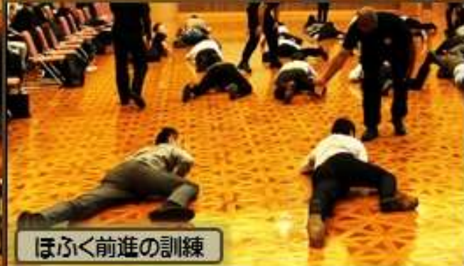
ほふく前進の訓練