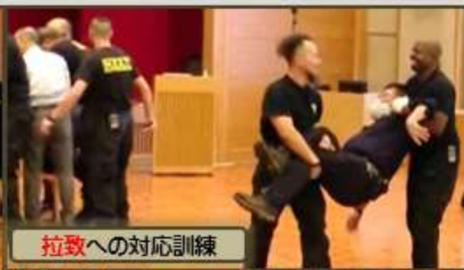
拉致への対応訓練