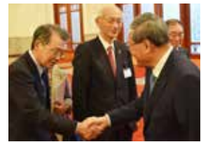
中国・李強首相（右）と握手する小林会頭

李強首相は、大規模な訪中団に歓迎の意を示すとともに、より緊密な二国間関係の構築、経済貿易関係のさらなる緊密化、ビジネス環境のさらなる最適化について言及した。