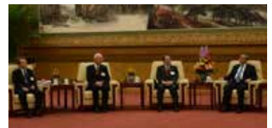
李強首相との会談