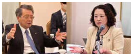
会談で発言する小林会頭（左）と芳野会長

中小企業の持続的な賃上げに向け、取引価格の適正化などを後押ししていく考えで一致。小林会頭は、「人への投資で経済成長を目指す点で政労使は同じ方向を向いている」と述べたのに対し、芳野会長は、「政労使が同じ方向性であり、この好機を生かすべきである」と応じた。