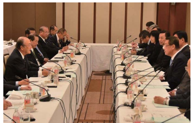
あいさつすると三村会頭（左）と吉川大臣（右）

日本商工会議所は2018年12月20日、吉川貴盛農林水産大臣との懇談会を都内で開催した。日商の三村明夫会頭は、地方創生実現のための重要な柱として農林水産業の再活性化を挙げるとともに、農商工連携のさらなる拡大が不可欠である点を強調。農商工連携を進めるに当たって課題となる販路開拓や商品の規格・量の確保に向け、資金面や専門家派遣に対する支援を要望した。また、ITを活用したスマート農業の推進に向け、技術開発と社会実装を同時並行で進めていくとともに、その横展開も図るよう求めた。