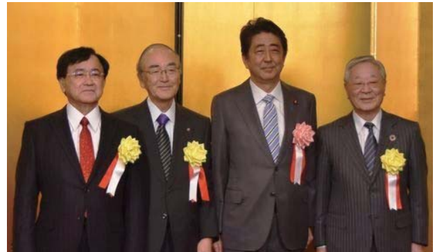
安倍首相（右から2人目）と三村会頭（同3人目）ら各団体トップ

頭は今年の景気見通しについて、「潜在成長率並みの1%程度でいくのではないかとコメント。リスク要因として米中貿易摩擦や英国のEU離脱、米国議会の混迷といった点を指摘した。また、最大のネックとして人手不足を挙げ、「ありとあらゆる手段を講じて日本の労働力不足に対処しなければいけない」と述べた。