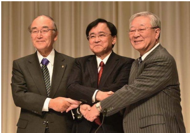
会見後に握手する三村会頭（左）ら各団体トップ

日本・東京商工会議所、日本経済団体連合会、経済同友会の経済3団体は1月7日、新年祝賀パーティーを都内のホテルで開催した。パーティーには、全国の経営者ら約1800人が出席し、安倍晋三首相も駆け付けた。