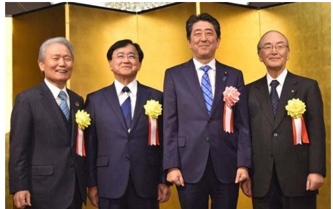
安倍首相（右から2人目）と三村会頭（右）ら各団体トップ

トップによる記者会見で日商の三村明夫会頭は、地方や中小企業に景気回復をいきわたらせるために重要な点として「生産性向上」を挙げ、「中小企業の生産性を引き上げない限り、日本全体の生産性は向上しない。商工会議所としてもできる限り早期に中小企業の生産性を引き上げるべく、いろいろな手を打って全力で支援していきたい」と述べた。