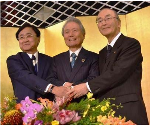
会見後に握手する三村会頭（右）ら各団体トップ

日本・東京商工会議所、日本経済団体連合会、経済同友会の経済3団体は1月5日、新年祝賀パーティーを都内のホテルで開催した。パーティーには、全国の経営者ら約1800人が出席し、安倍晋三首相も駆け付けた。