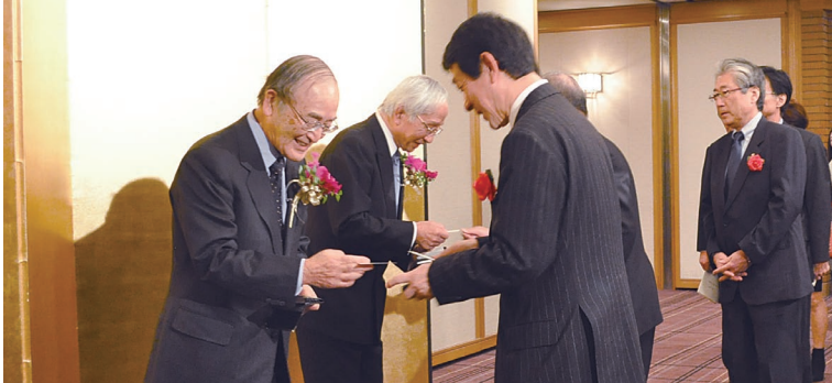
来場者に挨拶する三村会頭（左）と岡村名誉会頭（左から2番目）

日本商工会議所は11月21日、三村明夫会頭の就任披露パーティーを都内で開催。安倍晋三内閣総理大臣をはじめ、政財界から1,100人が激励に訪れた。