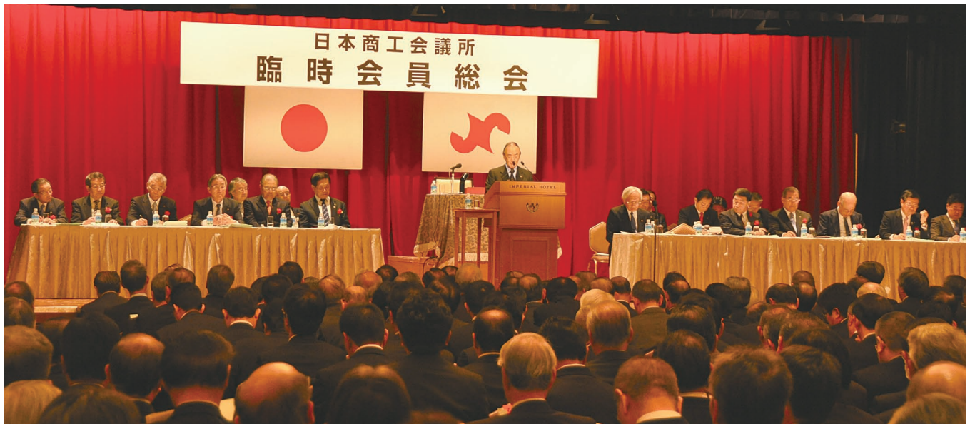
全国の商工会議所会頭・副会頭など約600人が出席した (敬称略)