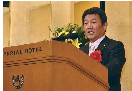
祝辞を述べる 茂木敏充経済産業大臣