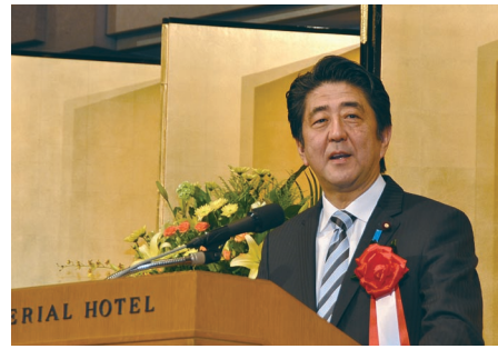
三村新体制に期待を込める 安倍晋三内閣総理大臣