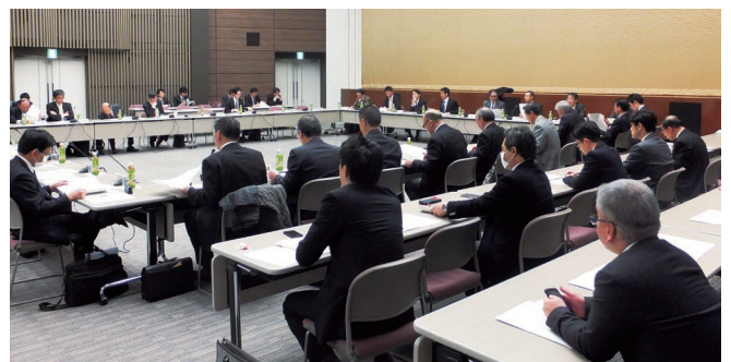
第3回研究会（平成25年11月22日）の様子

本ガイドラインの活用により、中小企業が一定の経営努力を行うことによって、「経営者保証に依存しない融資」を受けられる可能性が高まること