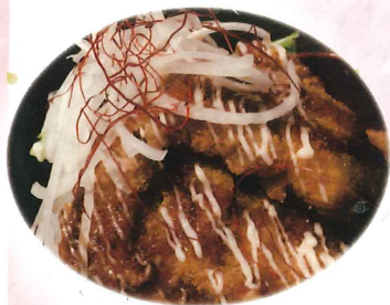
三崎直送! マグテール丼