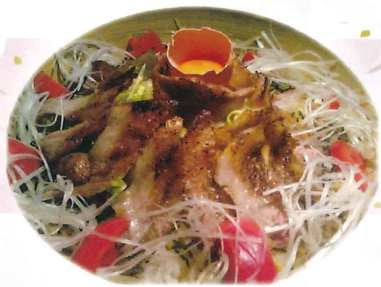
大和市チャンピオン 相模豚ドン!