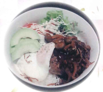
Ace 風煮込みハンバーグの ロコモコ丼