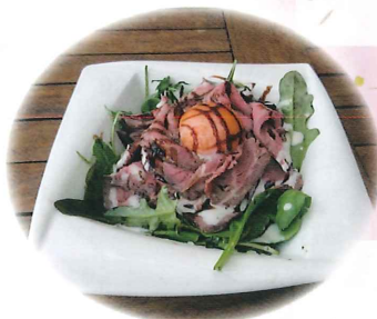
virginsunset 風 ローストビーフ丼