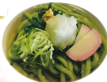
特製わかめ U DON