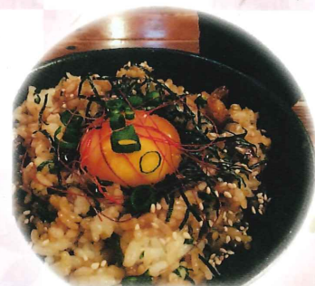
Golden wind 丼 (ゴールデン ウィンドン)