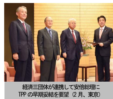
経済三団体が連携して安倍総理に TPPの早期妥結を要望（2月、東京）