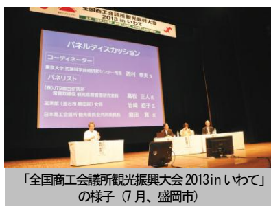
「全国商工会議所観光振興大会2013inいわて」の様子(7月、盛岡市)