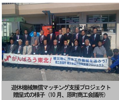
遊休機械無償マッチング支援プロジェクト 贈呈式の様子（10月、原町商工会議所）