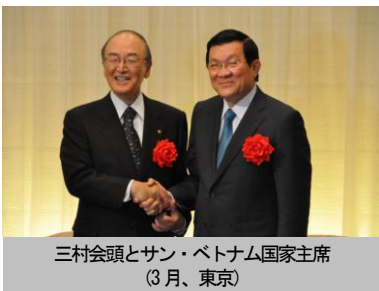
三村会頭とサン・ベトナム国家主席 (3月、東京)