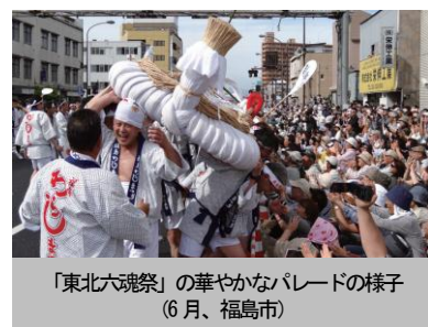
「東北六魂祭」の華やかなパレードの様子 （6月、福島市）