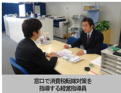
窓口で消費税転嫁対策を指導する経営指導員