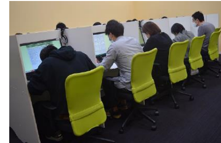
簿記検定のネット試験