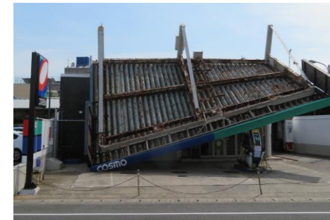
令和元年台風15号による建物の倒壊 (2019年9月)

○ 相次ぐ災害で融資を受け、多重債務を抱える被災事業者の資金繰りや販路開拓等へのきめ細かな支援、福島イノベーション・コースト構想の実現、原発処理水の海洋放出に伴う風評被害の防止や補償の必要性等を政府与党に提言する