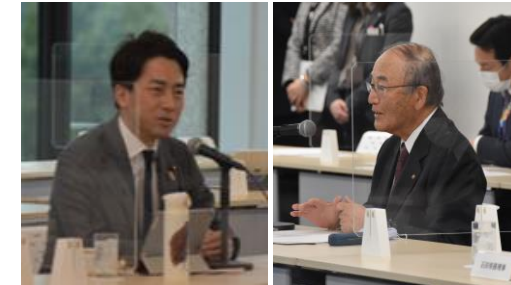
小泉環境大臣との意見交換会 (2020年12月)