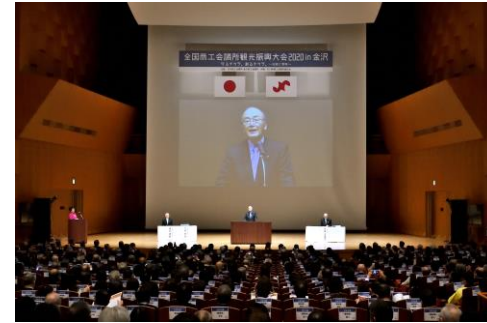
「全国商工会議所観光振興大会 2021in 金沢」 (2020年2月)