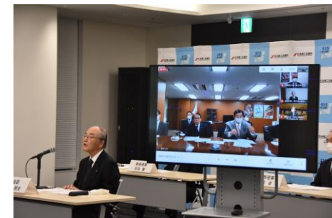
平沢復興大臣への要望手交式 (2021年3月)