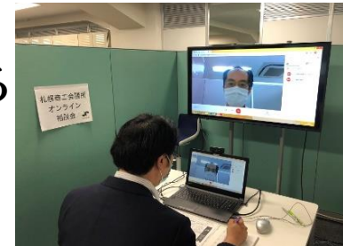
オンライン経営相談