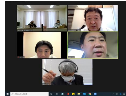
IT専門人材によるオンライン支援 (2021年2月)