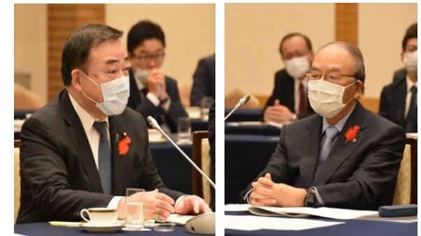
梶山経済産業大臣と日本商工会議所との懇談会 (2020年10月)