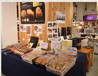
出店の一例 (坂出商工会議所)

※新型コロナウイルス感染拡大の影響により出店予定、出品内容は変更となる場合があります。あらかじめご了承ください