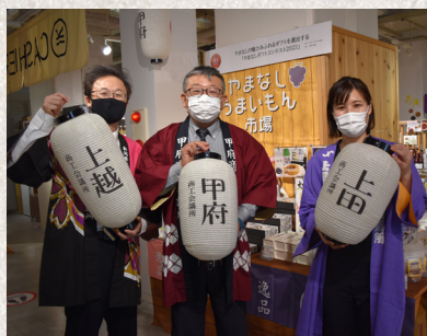
3商工会議所が初の合同出展

※新型コロナウイルス感染拡大の影響により出店予定、出品内容は変更となる場合があります。あらかじめご了承ください