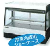
冷凍冷蔵用 ショーケース