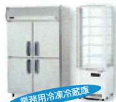
業務用冷凍冷蔵庫