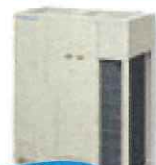
ビル用 マルチエアコン