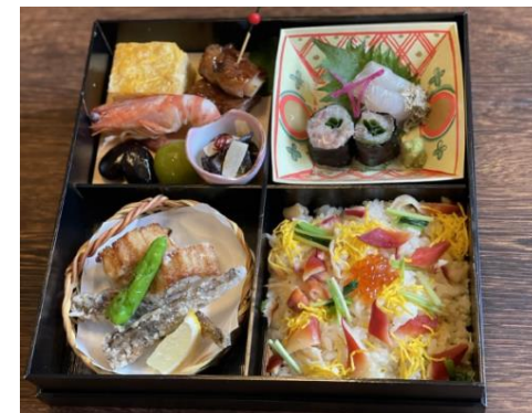
常磐もの穴子けんちん揚げ