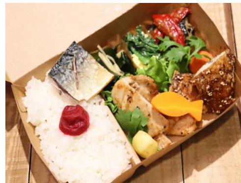
女川産のギンザケ塩焼き