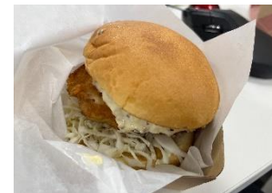
あんこうのフィッシュバーガー