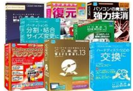
コンシューマー向け製品

これらの取り組みにより、平均勤続年数(男性:13.6年、女性:12.2年)と男女ともに社員の定着率は高く、高度な技術と専門知識に定評ある会社として信頼を築いている。