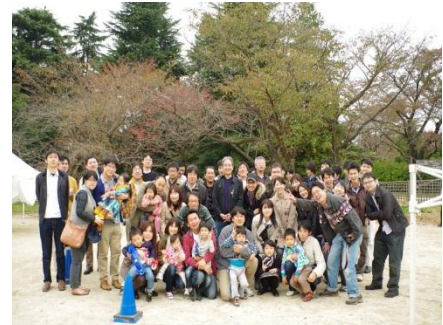
昨年の社内イベント・バーベキュー