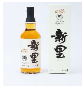
▲ 沖縄（沖縄県） 「新里 WHISKY」