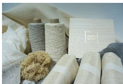
▲ 大和高田（奈良県） 「食べない吉野葛」