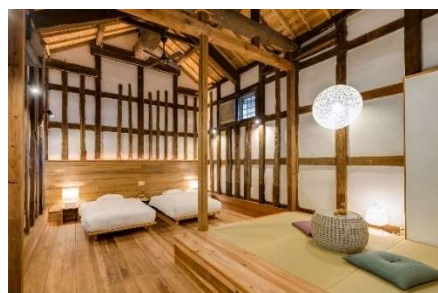
▲ 佐原（千葉県） 「佐原商家町ホテル NIPPONIA」