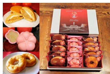
▲ 上田（長野県） 「真田 RED アップルスウィーツギフト」