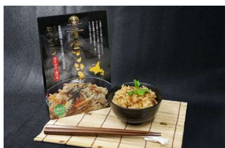
▲ 紋別（北海道） 「ほたて黄金ごはん」

本商談会は、各地商工会議所または地域の小規模事業者等が開発した特産品や観光商品等の販路開拓・拡大を支援するものです。今回は、 全国から48商工会議所（予定） が参加し、地域発の食・旅・技の商品等をPRします。